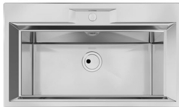
Fregadero FL 2975 060